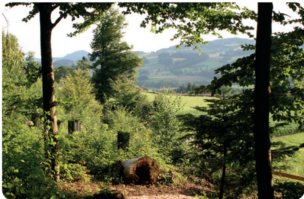
Instant magique au Sentier des Fées

Le conseil communal vous souhaite de belles fêtes de fin d'année. Nous espérons que l'année 2014 vous réserve de beaux moments tout au long des saisons.