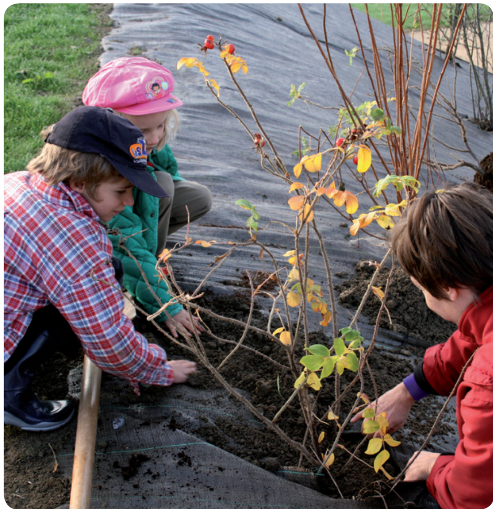
Instants magiques lors de l'arborisation de la nouvelle place multisports, le 12 novembre 2011