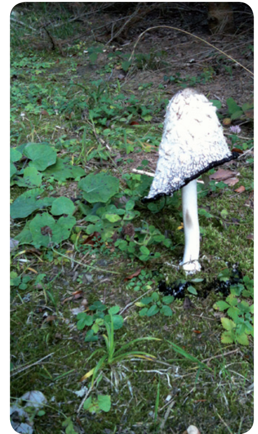
Votre fée Fuchia

Je vais aussi soutenir les hérissons dans la fabrication de leur nid douillet pour l'hiver, montrer aux oiseaux les fruits des arbres qu'ils pourront manger durant la saison froide, récolter le lichen pour réchauffer les lits des biches et des faons, enfin se préparer à l'hiver et aux frimas. Quant à vous rentrez vite après une balade dans la forêt, boire un thé chaud et manger une tarte aux pommes. Je sais que certaines dames du village en font d'excellentes. A tout bientôt !