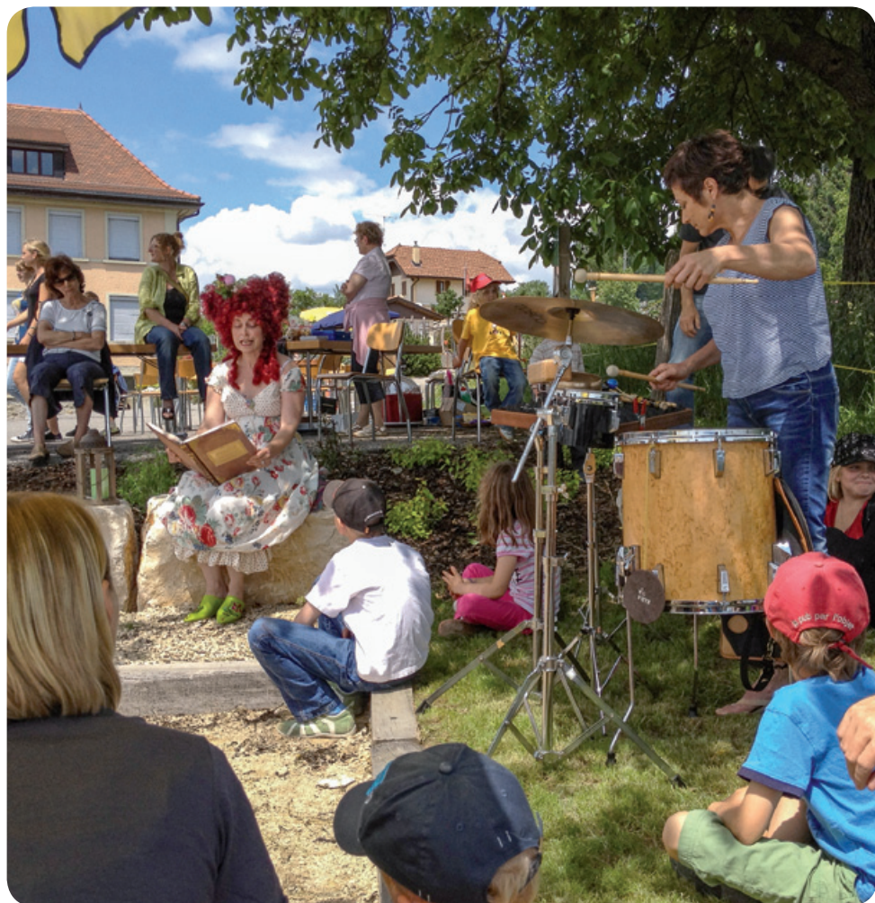
Inauguration de la place multisports, le 9 juin 2012