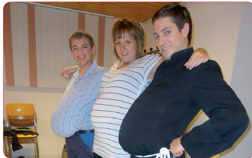
Clin d'œil dans les coulisses de la Bénichon 2012...